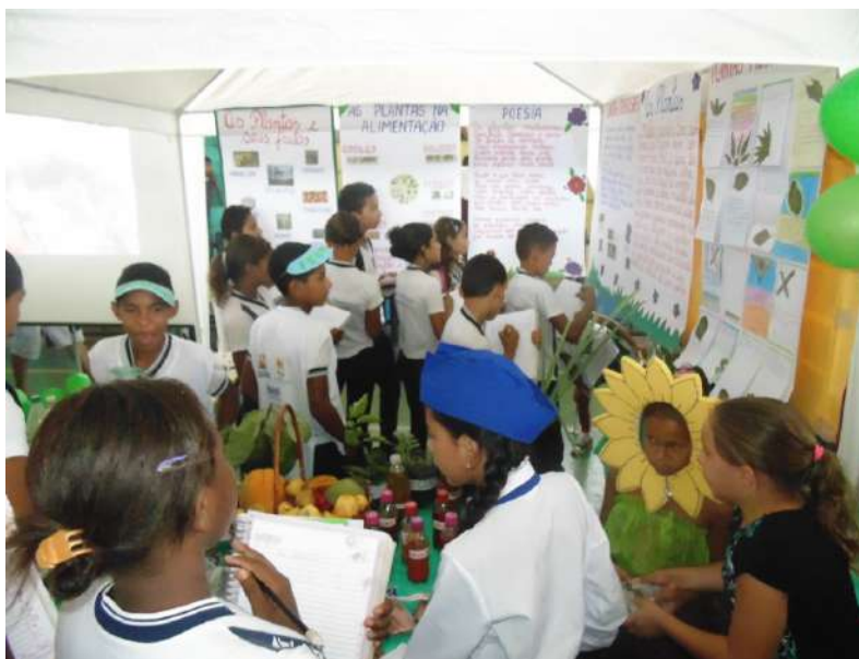
Figura 5: Alunos do Ensino Fundamental na I FERIA de Ciências Naturais e Exatas

O Ensino Fundamental de acordo com a LDB (Lei de Diretrizes e Bases da Educação Nacional), nº 9394/96, Art. 32, será obrigatório a todas as pessoas e