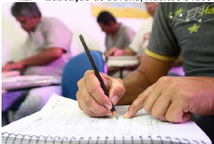
Figura 9: Educação de Jovens, Adultos e Idosos

A Educação de Jovens, Adultos e Idosos é um direito constituído a todo cidadão. A LDB Nº 9.394/96 nos artigos 37 e 38 relatam que a Educação de Jovens, Adultos e Idosos é uma modalidade de ensino destinada às pessoas que não tiveram acesso ou que não deram prosseguimento ao ensino fundamental e médio