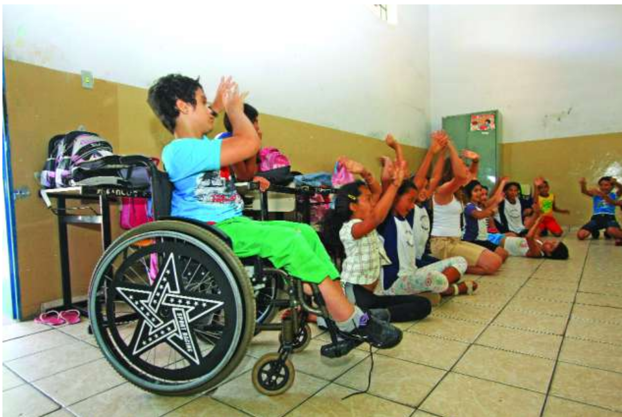
Figura 8: Educação Especial