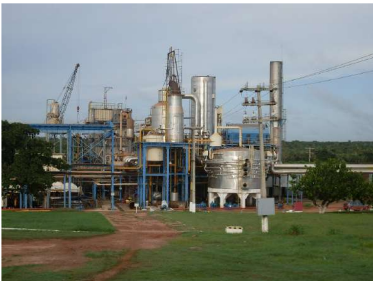
Figura 3: Itapecuru BioEnergia