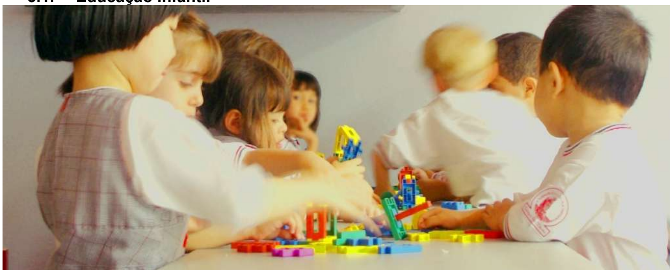
Figura 4: Educação Infantil