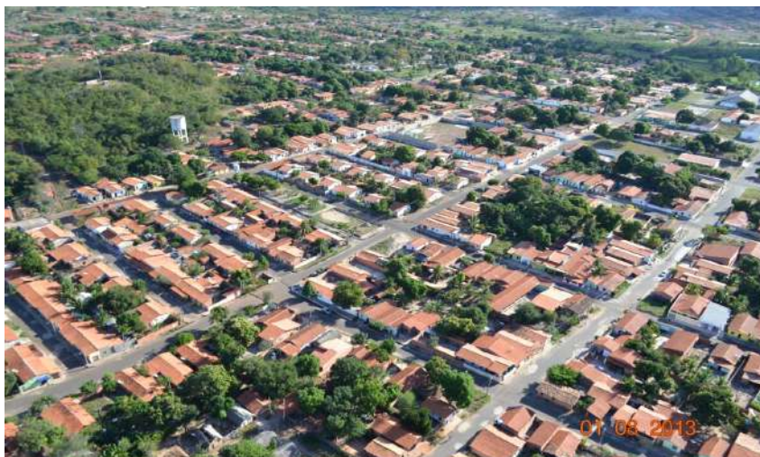
Figura 2: Imagem aérea de Aldeias Altas