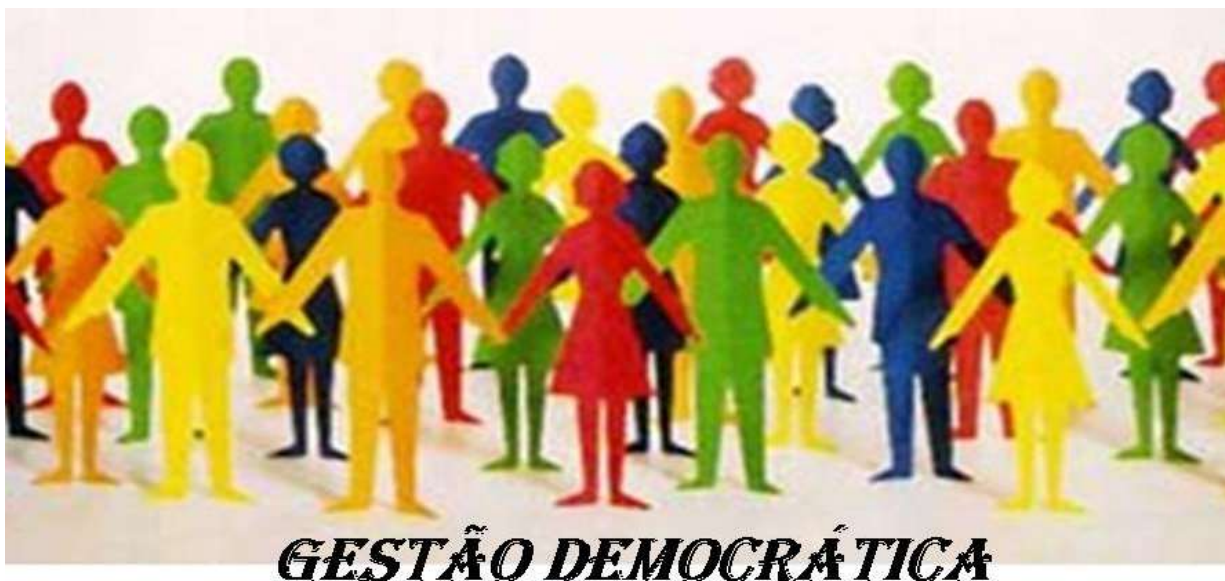
Figura 10: Gestão Democrática, Participação Popular e Controle Social.

A Constituição brasileira garante o direito a todos os cidadãos de participar da vida pública, direito que exige estabelecer uma gestão democrática na educação pública, baseada nos valores e sentidos que os educadores preconizam sobre educação emancipadora como exercício de cidadania em uma sociedade democrática. Em educação, Gestão Democrática não se resume em leis e normas estabelecidas pelo poder legislativo, faz parte de um princípio pedagógico, destacando que a participação popular e a gestão democrática fazem parte da própria natureza do ato pedagógico.