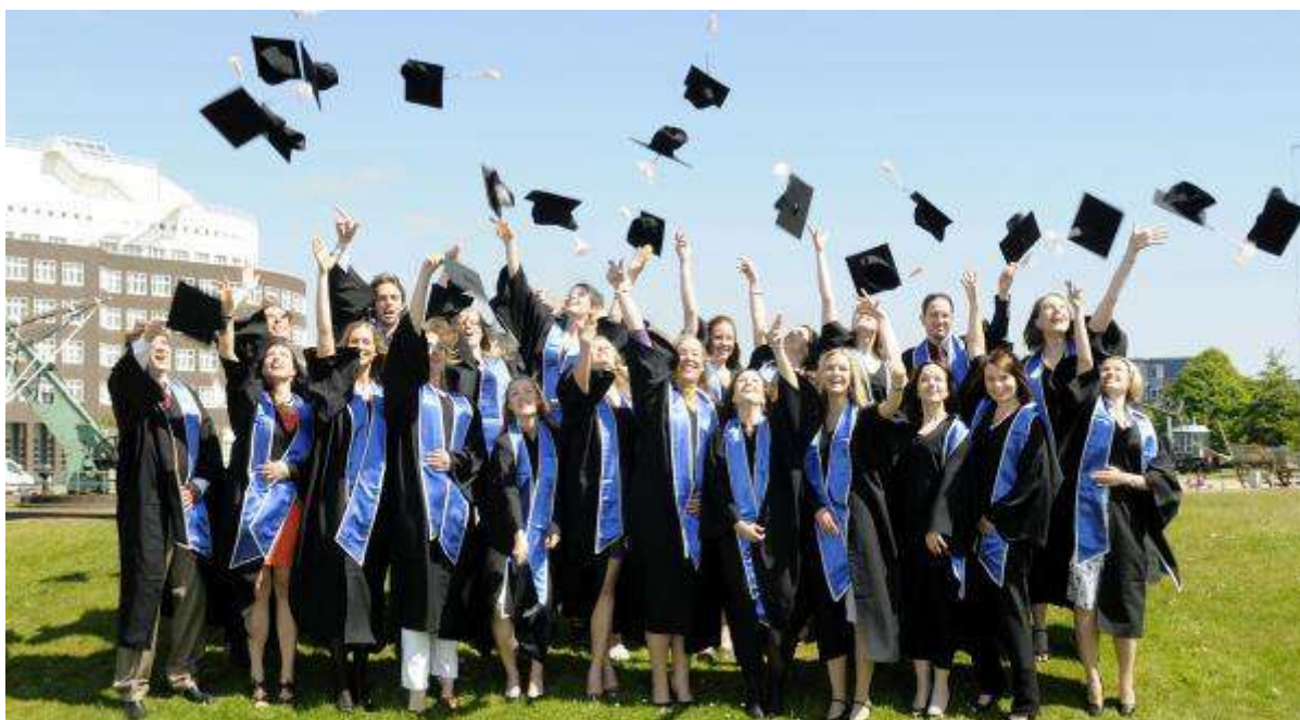
Figura 7: Educação Superior

A Educação Superior é um dos níveis de ensino estabelecido pela Lei Nº 9.394/96, no seu Art. 21 e na Constituição no Art. 1º prevê como princípio a “igualdade de condições para o acesso e permanência na escola”, bem como o acesso a níveis mais elevados de ensino..